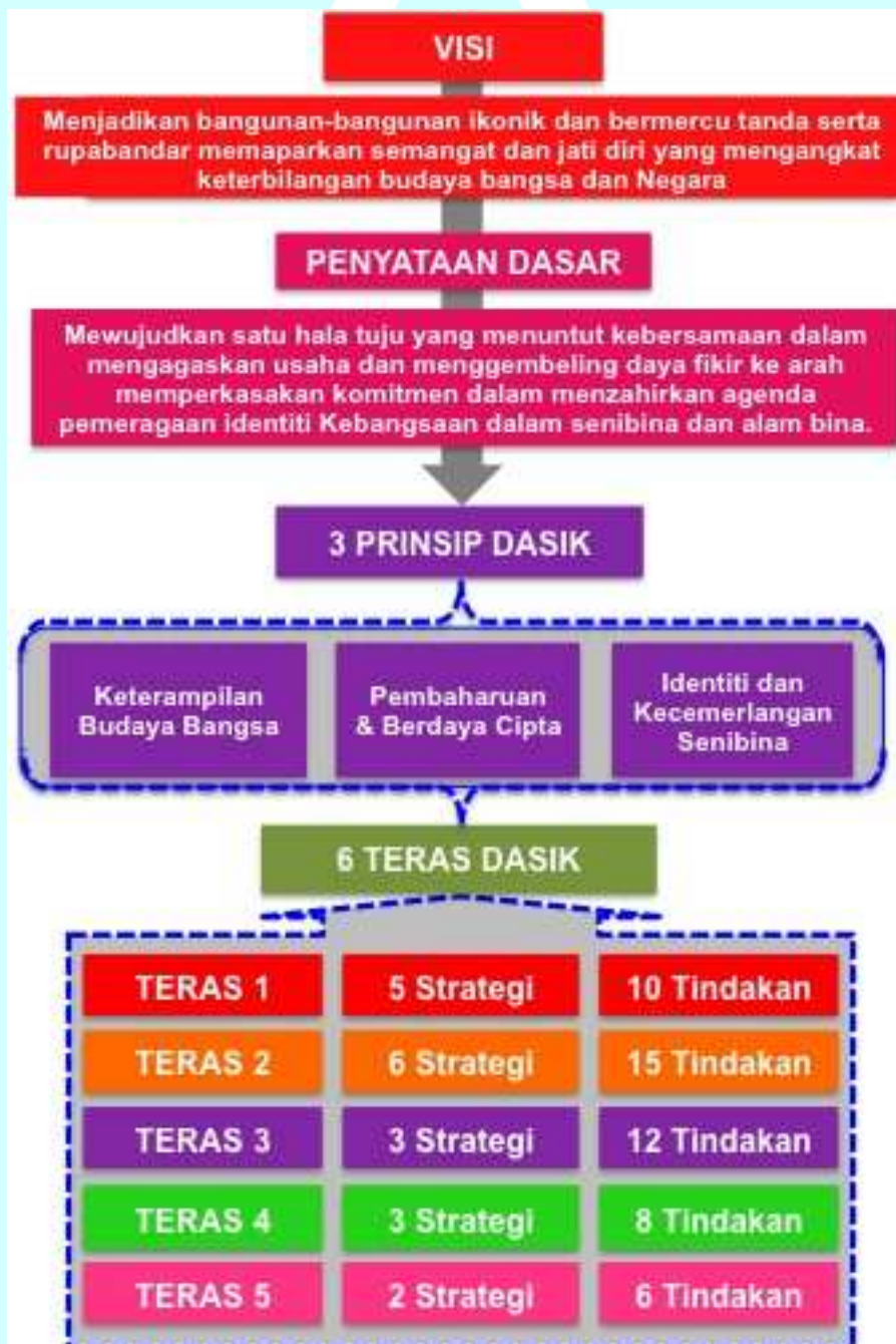
Rajah 1: Kerangka Dasar Senibina Identiti Kebangsaan